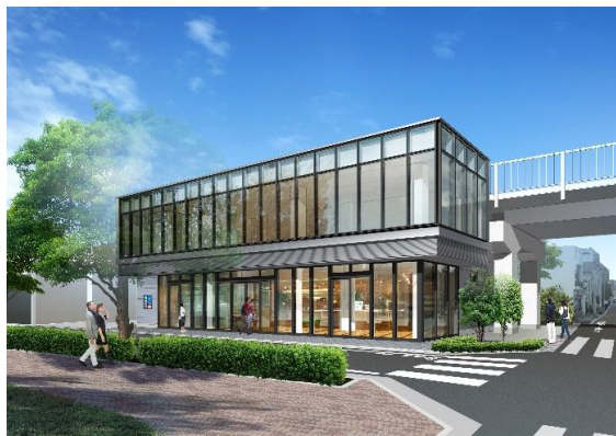
メトロード志村三丁目Ⅱ 完成予想図